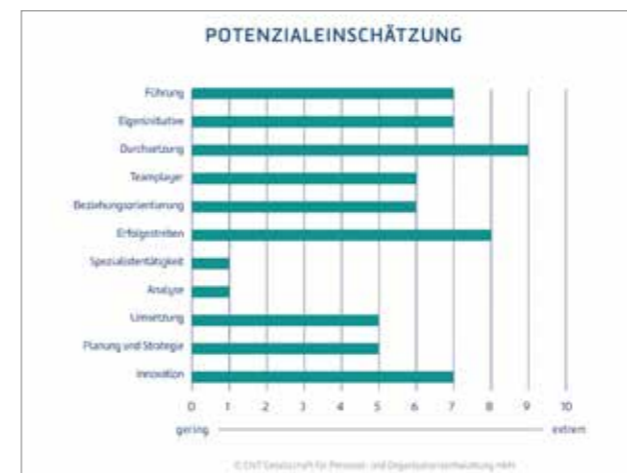
Ergebnisdiagramm aus „CAPTain“

Validität von Personalauswahlverfahren: Das Risiko von Fehlentscheidungen kann mit professionellen Verfahren deutlich reduziert werden. Ungeeignete Mitarbeiter werden nicht ungerechtfertigt befördert und vorhandene Talente tatsächlich erkannt.